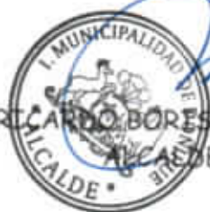
RICARDO BORES ACUÑA GONZALEZ ALCALDE