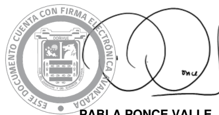
PABLA PONCE VALLE Alcaldesa