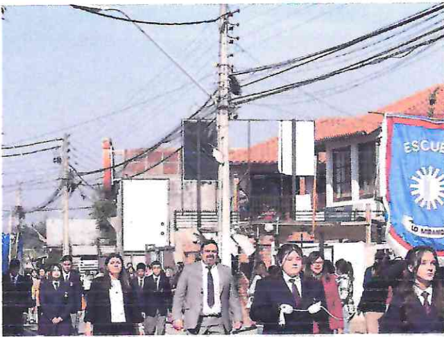
Desfile Glorias Navales, Doñihue.