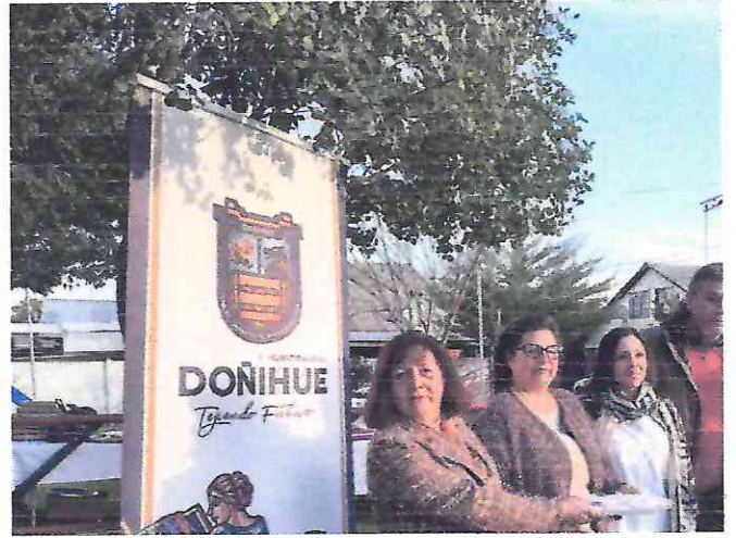
Ceremonia 8%, Villa Sor Teresa, Lo Miranda