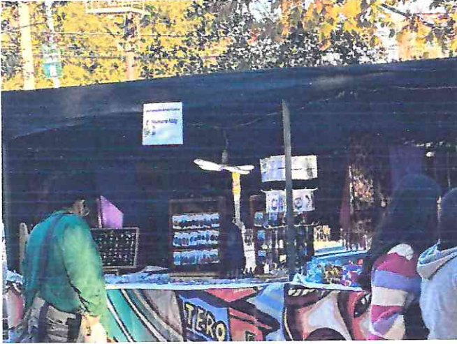
Feria emprendedoras Día de La Madre, Lo Miranda