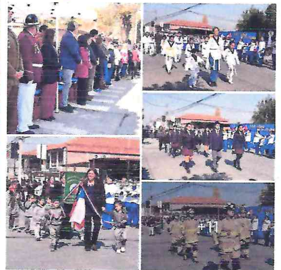
Doñihue rindió honores a nuestras Glorias Navales... más