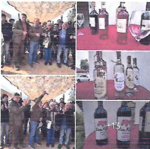
EL CORAZÓN DE DONIHUE TIENE NUEVO HOGAR: INAUGURAMOS LA GALERÍA... más